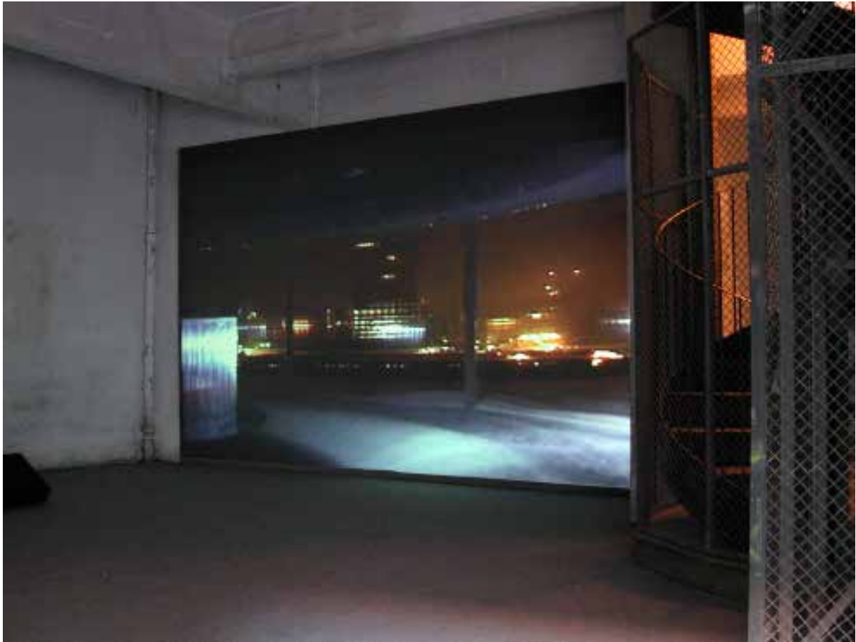
Autobrouillard , 2003 Vidéo DVD, SD 4/3, 36 min Production Emmetrop (Transpalette Bourges) et Agnes b