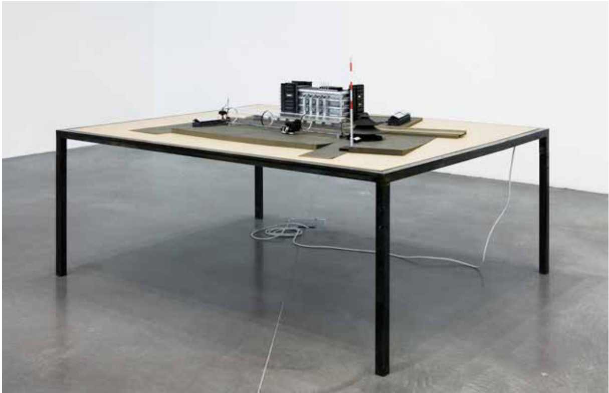
Exhibition view La Fabrique des Possibles , FRAC PACA, Marseille, 2013