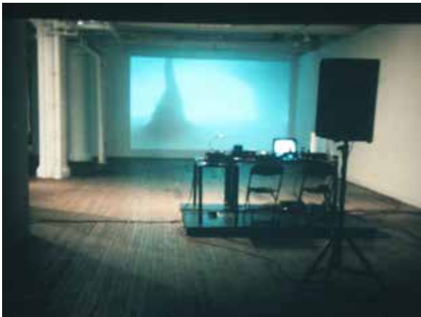
Vortex , 2007 installation view

+ In one of his last performances, the subject as the upturned image of a cyclone, in an inefinable context, between cloudy sky and desert. Vortex is an event with neither narration nor beginning nor end. A meteorological phenomenon takes place in the exhibition room. An effect for a Hollywood disaster blockbuster where everything is revealed. The performance itself borrows from the codes of a DJ set: a turntable put on slow-mo, no vinyl, the needle sliding over the rubber giving off sighs, static, tearing. A cylinder filled with water, then spun, induces a whirlpool whose spirals catch debris: a "vortex machine"