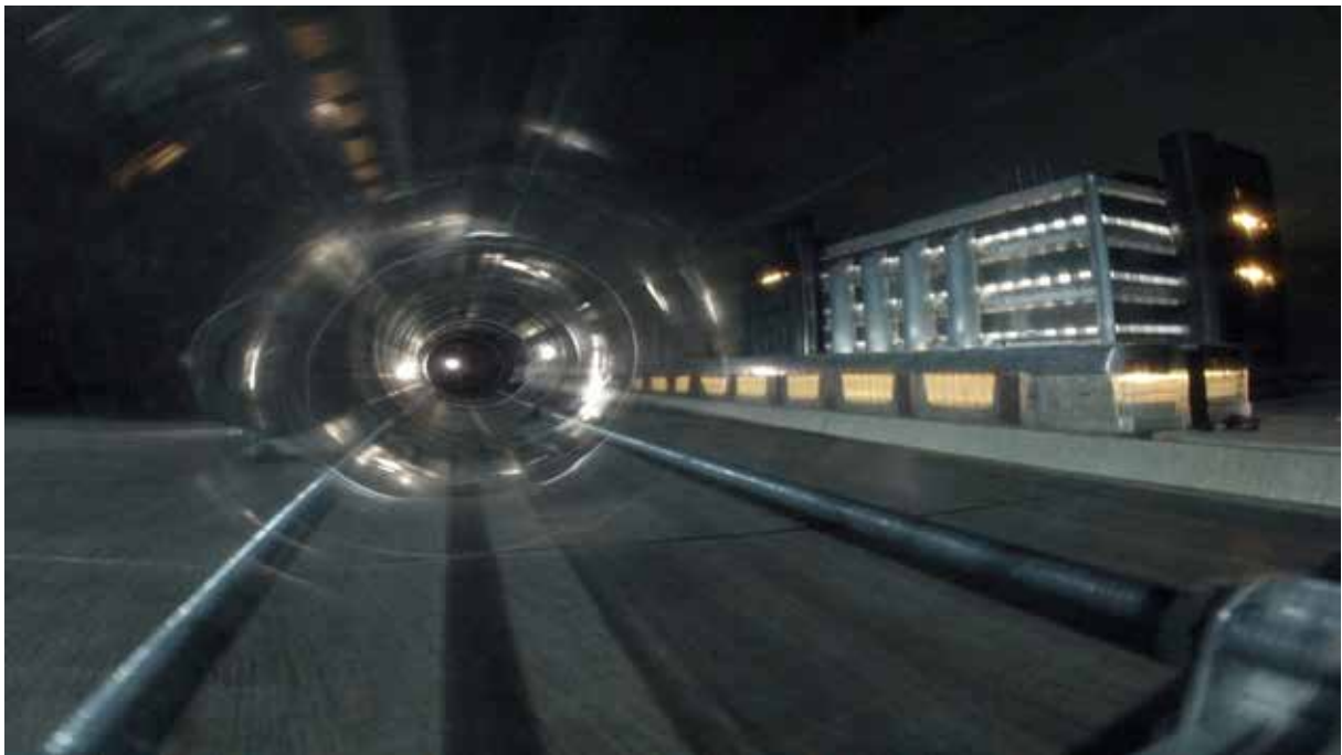
Cyclocity , 2012 Video HD, 13 minutes, loop edition of 4 + 1 AP

the architectural model “Cyclo City” focuses on the railway site in the city of Nancy, which repeatedly appears in Bertrand Lamarche’s work in its twofold aspect. on the one hand, the model pays attention to urban reality and its surroundings, in both their architectural and cultural dimensions. on the other hand, it breaks up this reality into fictional elements, that the artist then puts together and takes apart, as in a scenario.. this modeling also exceeds the referral to an outside reality, it integrates fictional features of Bertrand Lamarche’s universe such as a lighthouse, a future location for a garden of hogweeds, a transparent plastic tube in front of the mail sorting center. resembling a “wormhole” in the midst of urban space, this rotating tunnel functions both as an optical instrument and as a time-loop right out of science fiction. its transparent surfaces.