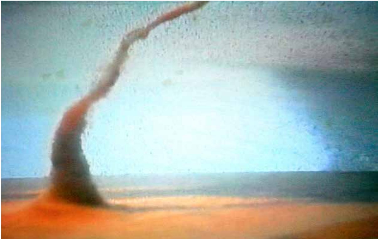
Vortex , 2007 Vidéo 30', loop DV/DVD Édition of 4+ 1 AP