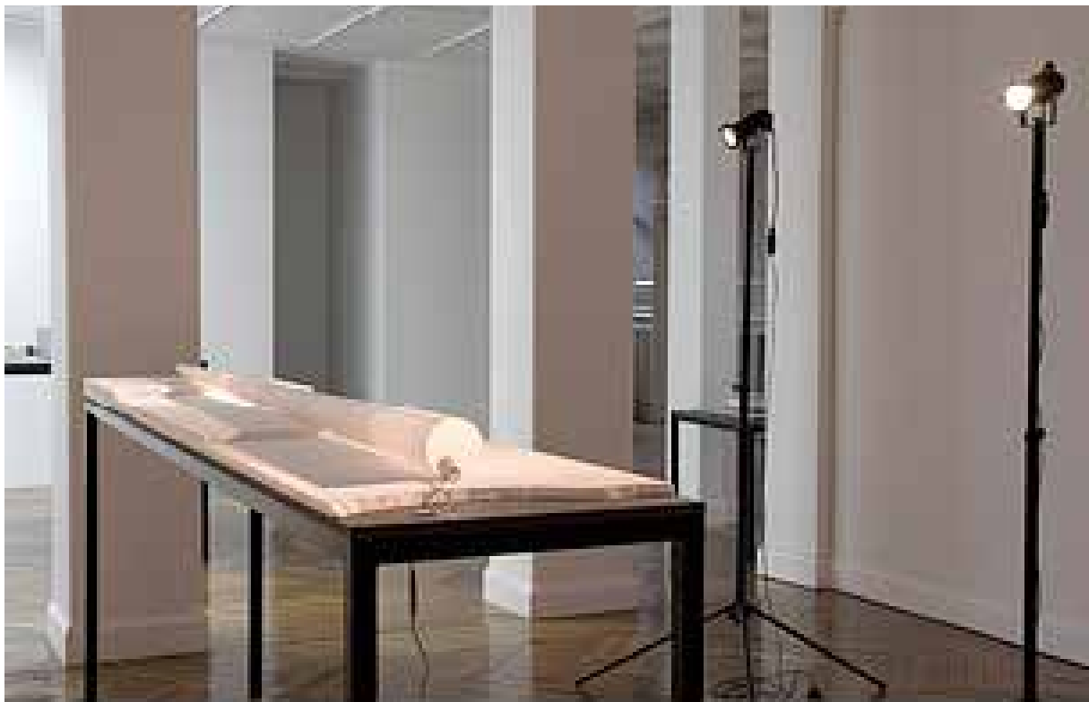
Cyclotunnel (a movie set) , 2008 installation, model polystyrène, PVC, camera, projection 300 x 60 x 15 cm Production La Galerie, Centre d'art contemporain de Noisy-le-sec Collection of FNAC Edition de 4 + 1 EA © Cédric Eymenier