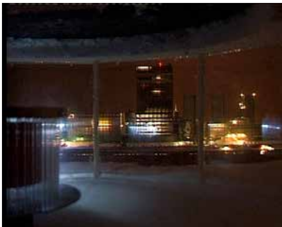
Autobrouillard , 2003 videostill

The video Autobrouillard (Auto-Fog) is a polychromatic nocturnal view of an illuminated city progressively invaded by mist. Autobrouillard , filmed using a scale model just as Hollywood movies do for special effects, adapts the themes of city-as-set and the self-managed metropolis. We immediately recognize Bertrand Lamarche's universe: the themes and motifs (architecture, maquettes, vortices, spires, hurricanes, fog) of an artist, a monomaniacal inventor, whose workshop produces miniatures of atmospheric phenomena. He makes machines that generate processes filmed by a built-in camera. The resulting image is often a spiral or whirlwind in Tore [1998] and Station des eaux usées [Water Recycling Plant, 2002]; Autobrouillard shows two rotating movements). Autobrouillard constructs the atmosphere of a fiction in which the common reference is an ideal autarkic city.