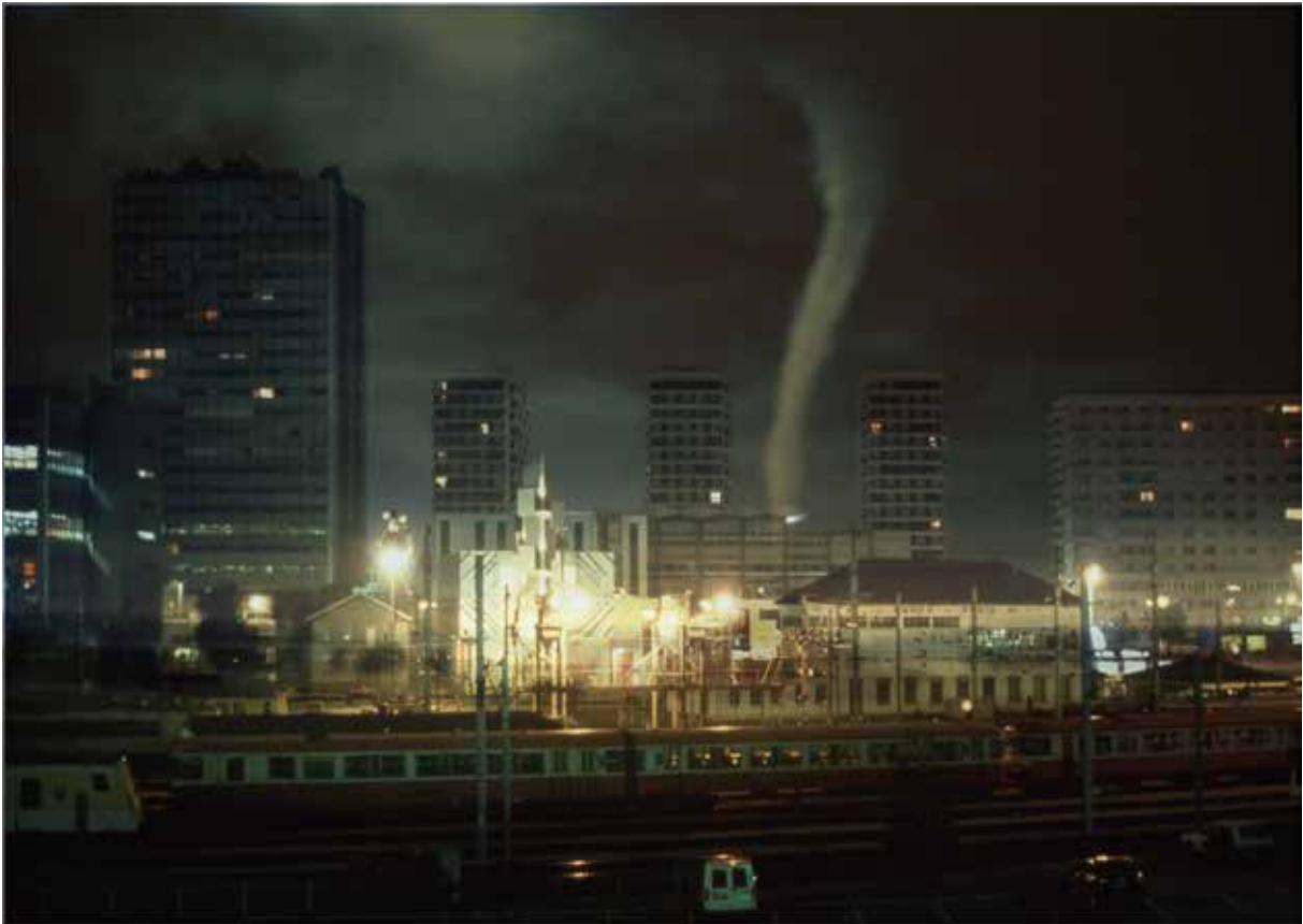
Vortex , 1997

Superposition de diapositives, tirage photographique