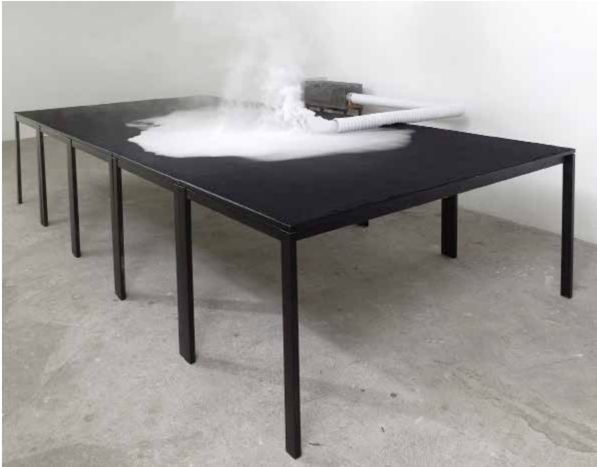
Map , 2011 Installation, fog machine, fabric, tables collection Contemporary Art Museum Rochechouart Edition of 3 + 1 AP © François Fernandez