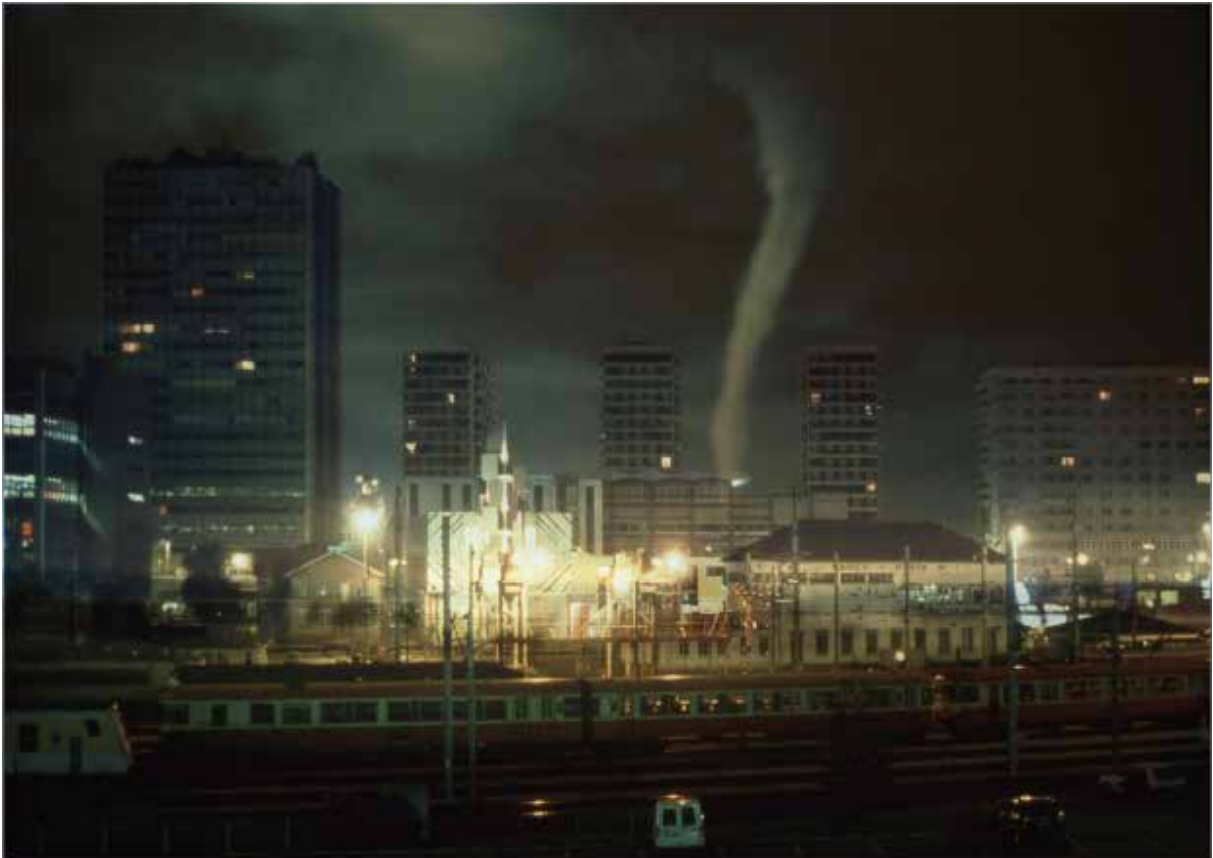
Vortex , 1997 Superposition de diapositives, tirage photographique