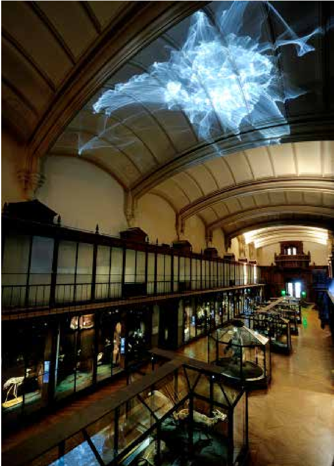
Vue de l'installation, FIAC Hors les murs 2012, Musée National d'Histoire Naturelle