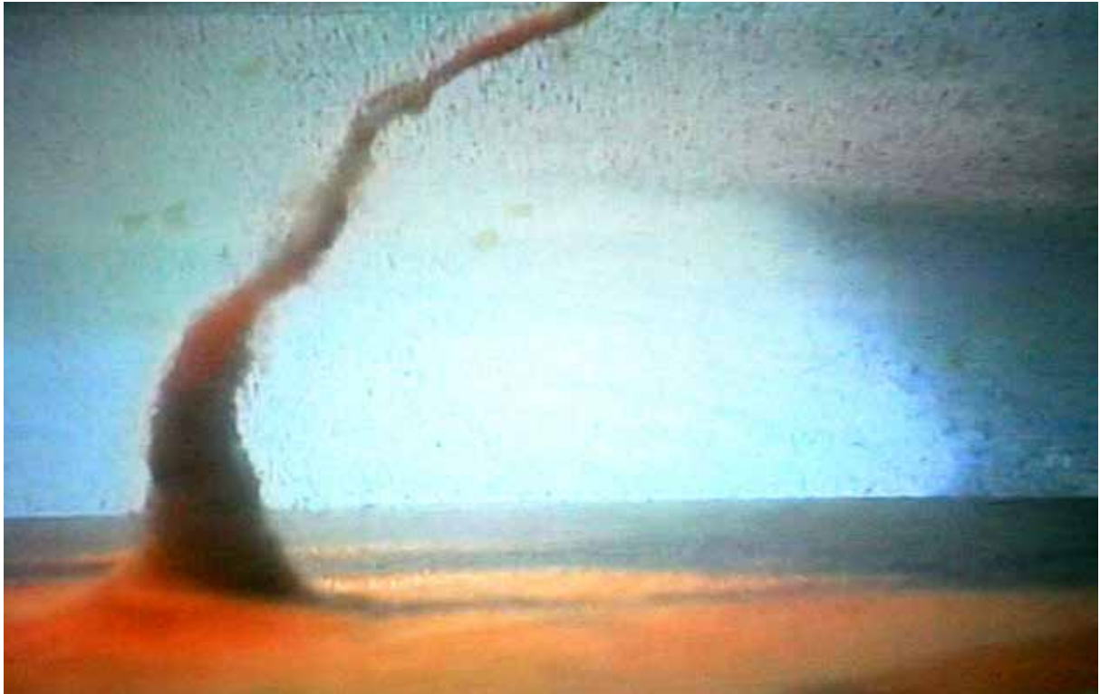
Vortex , 2007 Vidéo 30', boucle DV/DVD Édition de 4+ 1 EA