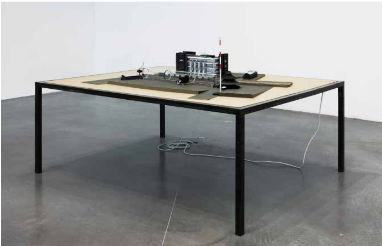
Vue de l'exposition «La Fabrique des Possibles», FRAC PACA, Marseille, 2013