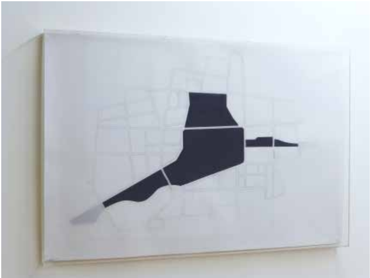
Lac noir , 2013 mine de plomb, collage vnyile sur bois laminé peint et ciré 100 x 150 x 9 cm unique