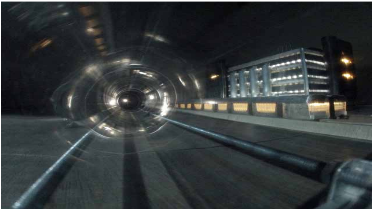
Cyclocity , 2012 Video HD, 13 minutes, loop édition de 4

Reprenant une nouvelle fois du site ferroviaire de la ville de Nancy que l'on retrouve souvent dans son œuvre, « Cyclo city » témoigne de façon caractéristique d'une dualité dans le travail de Bertrand Lamarche. Une attention portée au réel urbain, architectural et culturel du site et de ses alentours d'un côté. Un éclatement des rapports de ce réel en éléments fictionnels, que l'artiste noue et dénoue à la manière d'un scénario de l'autre. Prise depuis le viaduc Kennedy, cette vue panoramique frontale modélise un réel qui a été partiellement effacé. Cette maquette excède cependant ce rapport au réel, en y incluant des éléments fictionnels tel un phare situé dans l'axe d'un tube de plexiglass apposé devant le centre de tri postal. ressemblant à un « trou de ver » creusé dans l'espace urbain, ce tunnel rotatif fonctionne en même temps comme un instrument optique ou une machine temporelle de science fiction, déformant le réel à travers sa surface transparente.