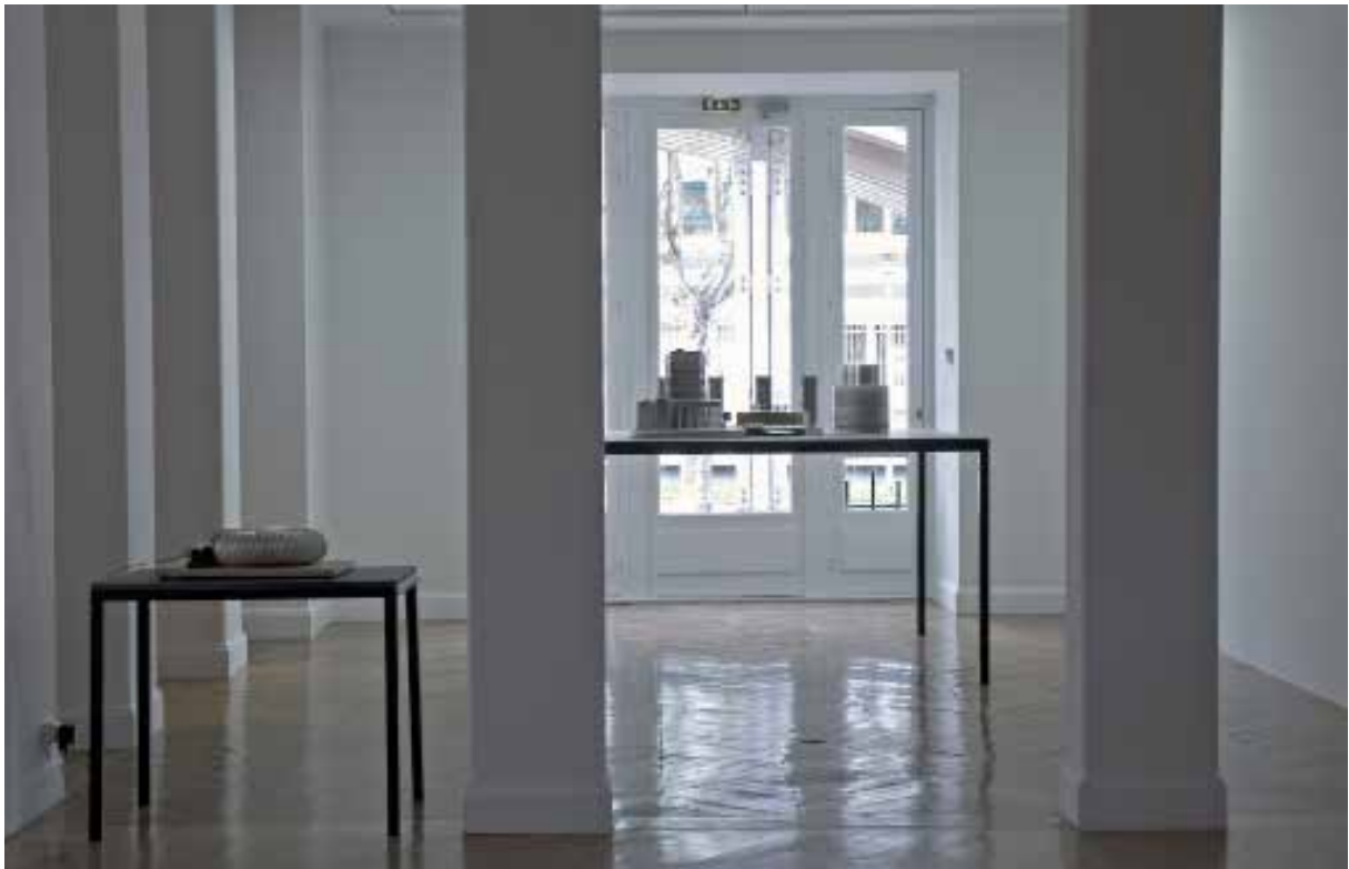
Vue de l'exposition personnelle The Funnel à La Galerie, Centre d'art de Noisy-le-Sec ,2008