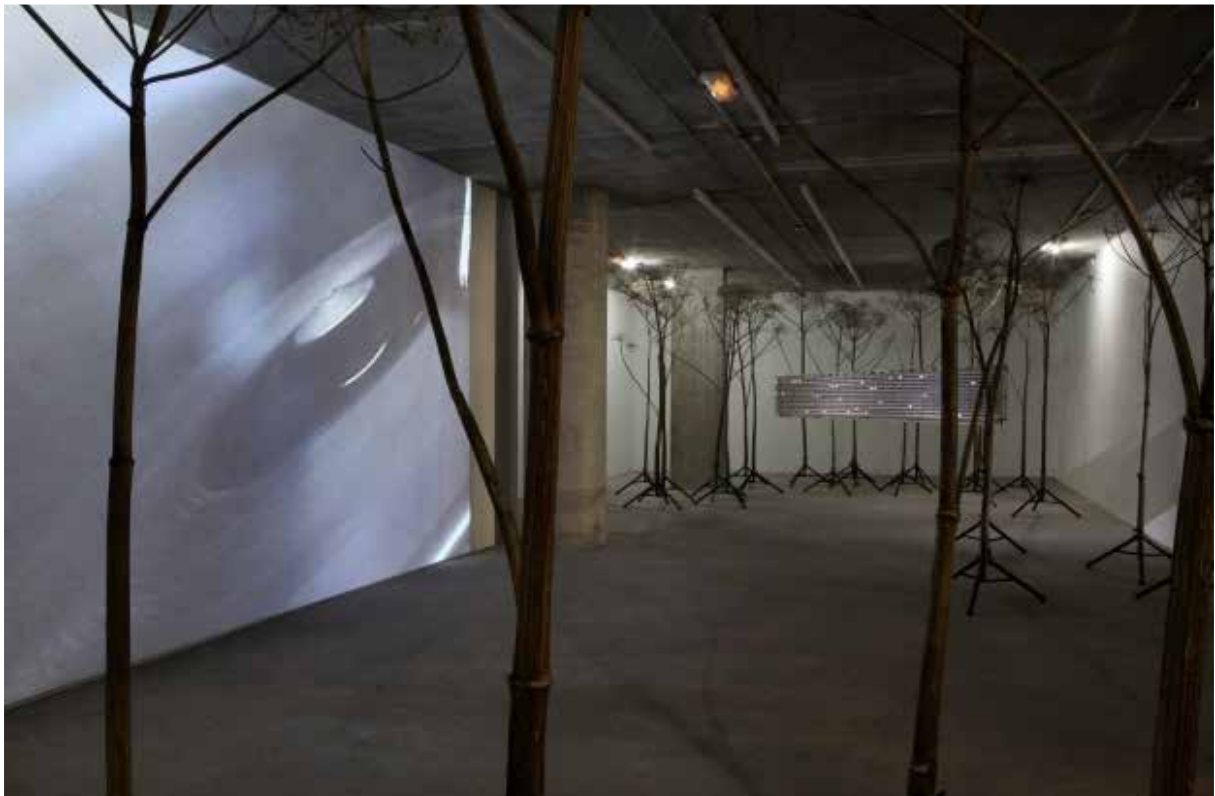
Vues de d'exposition au Centre de Création Contemporaine de Tours (CCC), 2012