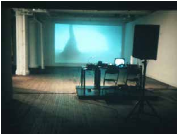
Vortex , 2007 vue de l'installation

+ Dans l'une de ses dernières performances, Lamarche donnait à voir l'image renversée d'un cyclone, dans un contexte indéfinissable, entre le ciel nuageux et le désert. Vortex Lounge est un évènement sans narration, où il n'y a ni début ni fin. Un phénomène météorologique a lieu dans la salle d'exposition, comme si l'on dévoilait la mécanique d'un trucage pour film-catastrophe hollywoodien. Le dispositif de cette performance emprunte aux modalités du set DJ : une platine tourne au ralenti sans vinyle, émetant des souffles, des crachotements, des déchirements, avec le diamant de lecture posé directement sur le caoutchouc. Un cylindre rempli d'eau, mis en rotation, induit un tourbillon dont les spirales avalent des débris : une «machine vortex»