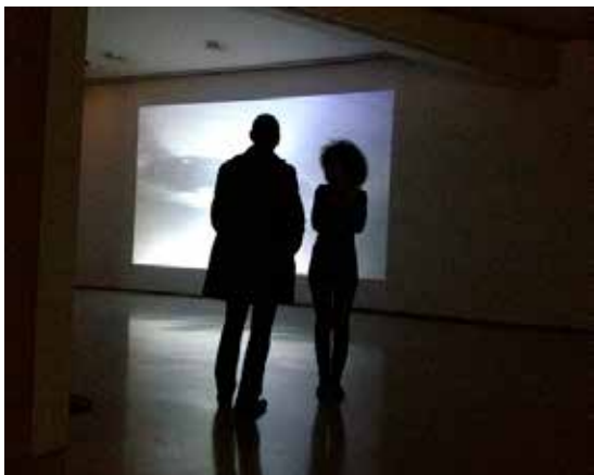
Vue de l'exposition La Quatrième dimension MAMAC Nice 2013