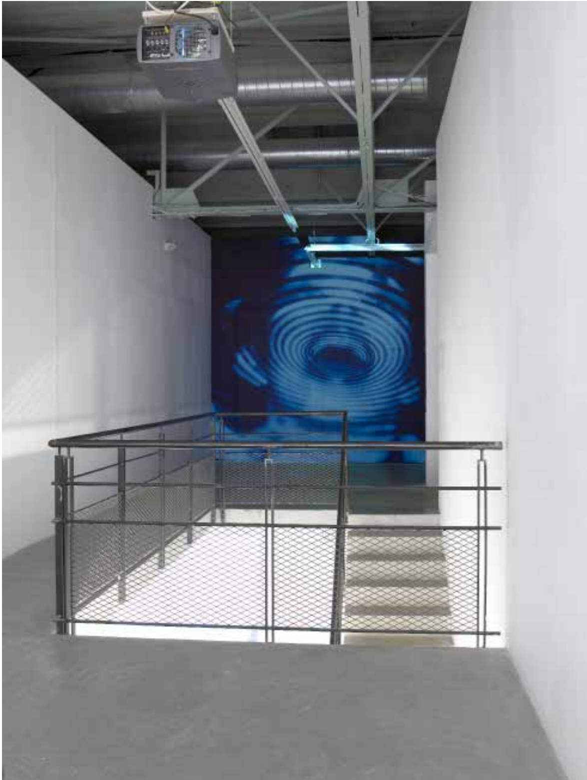
The Funnel facade , 2006

Vue de l'exposition «The Double Twin» au CRAC de Sète, 2006