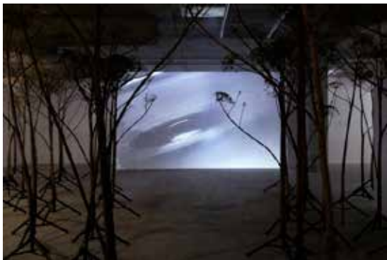
Vue de l'exposition personnelle au CCC de Tours

installation, vidéo, Vidéo SD 16/9, 10 min, loop Edition de 3 + 1 EA