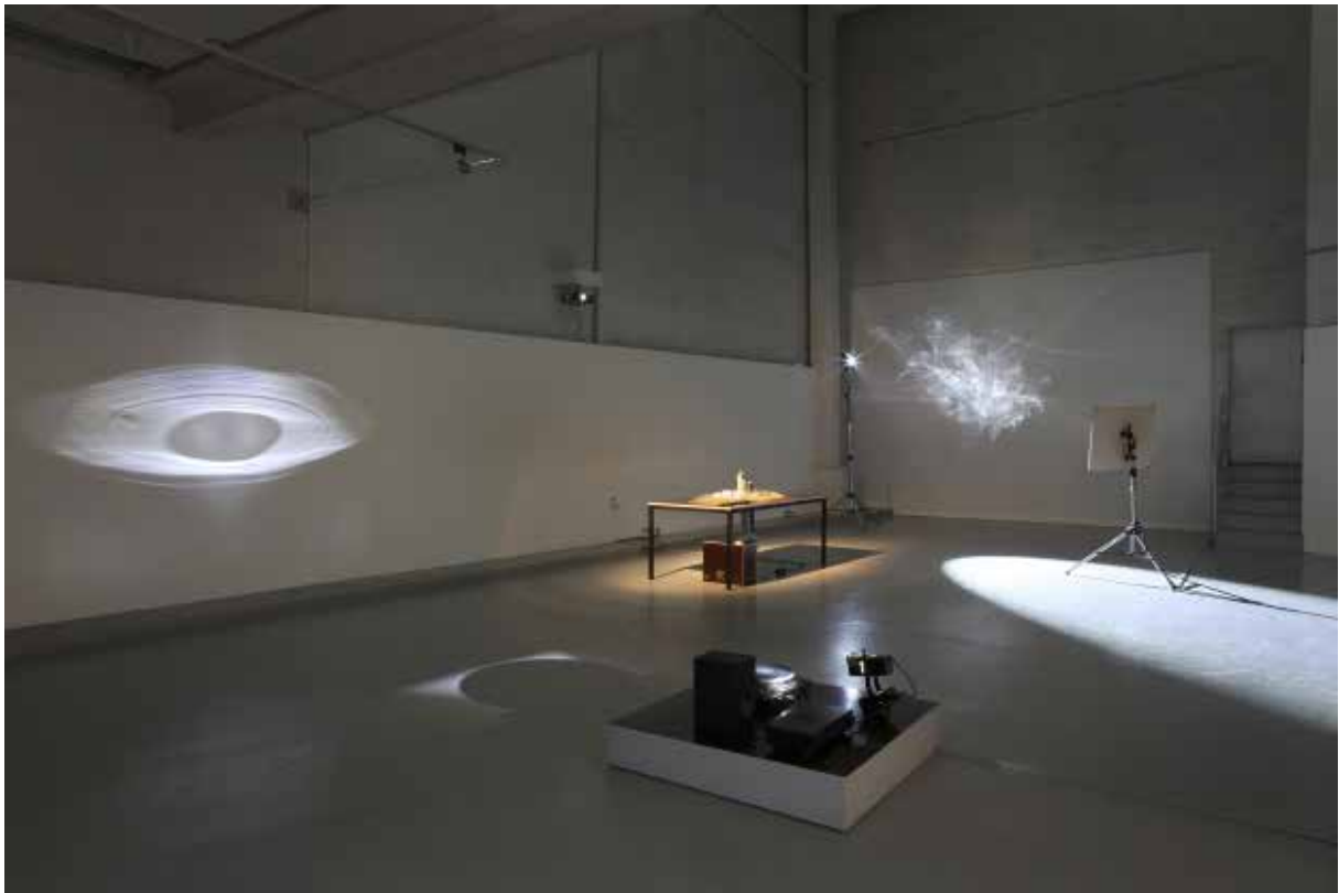
Vue de l'exposition personnelle au FRAC Centre (Orléans), 2012